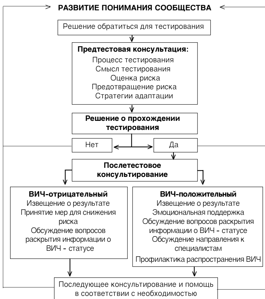
Рисунок 1 : ПРЕДТЕСТОВОЕ И ПОСЛЕТЕСТОВОЕ КОНСУЛЬТИРОВАНИЕ

консультации до или после тестирования, либо в период ожидания клиентом результата теста.